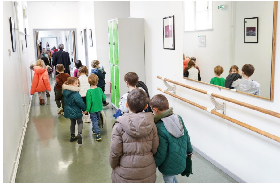
Réunion d'informations Parcours Premiers Pas